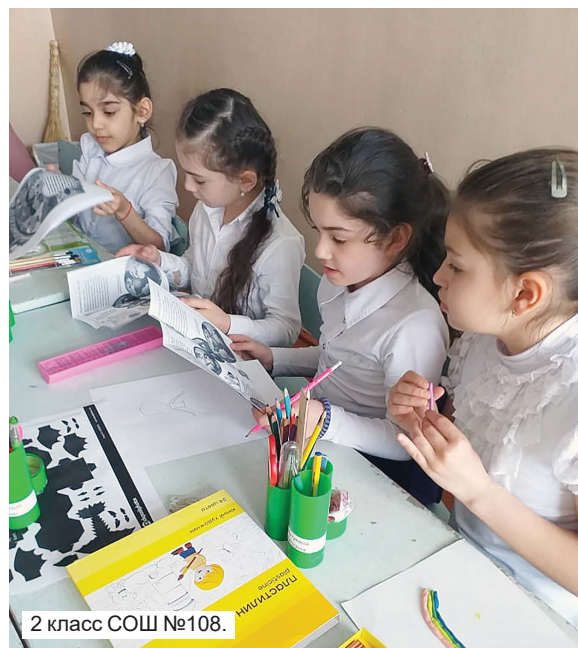
2 класс СОШ №108.

Однако ничто не заменит живого общения. Дистанционно детям информация воспринимается хуже. А речь идёт о таком важном понятии, как бережное отношение к природе – нашему дому. Оттого так ценны мероприятия, которые проводятся педагогом перед классом или на природе. Таких в 2021 году было немного. Например,